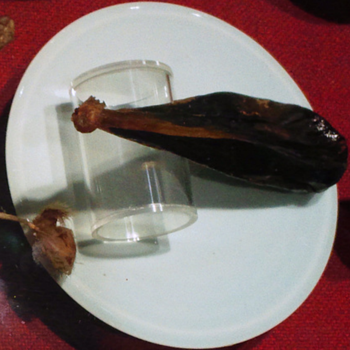
웅담 熊膽 / Fel Ursi 청혈(靑血) 清血(靑血), 소영(消靑) 熊(熊) Ursus arctos Linné의 담낭(膽囊)