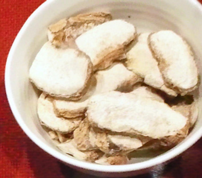
산자고 山慈姑 / Cremastrae Tuber 瘡癰腫毒, 癰疽疔瘡(火瘃散結)