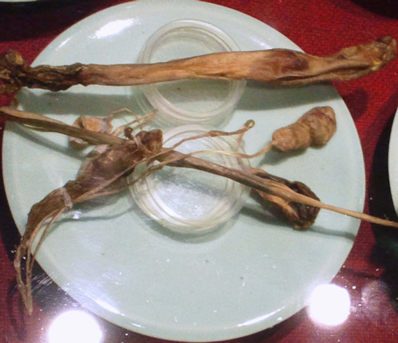
해구심 海狗腎 / Otocoa (Seal Penis) 신장(腎臟)에 들어있는 고상(柱)의 精液(精液) 精(精) Zeirin(海狗)의 精液(精液) Otocoa (Seal Penis)의 精液(精液)과 高(高)精(精)