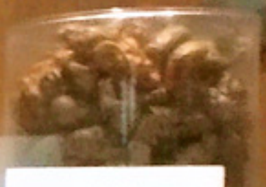
신뢰 신뢰 신뢰