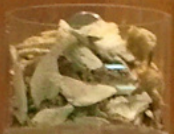
명검 명검 명검