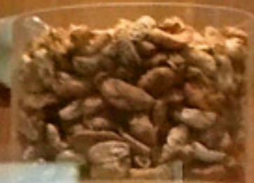
은 은 은