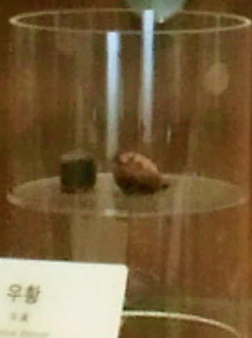
우황 우황 우황