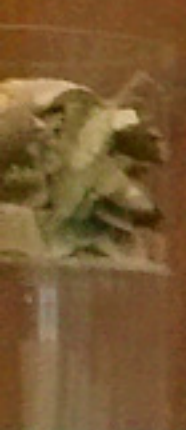
명승 명승 명승